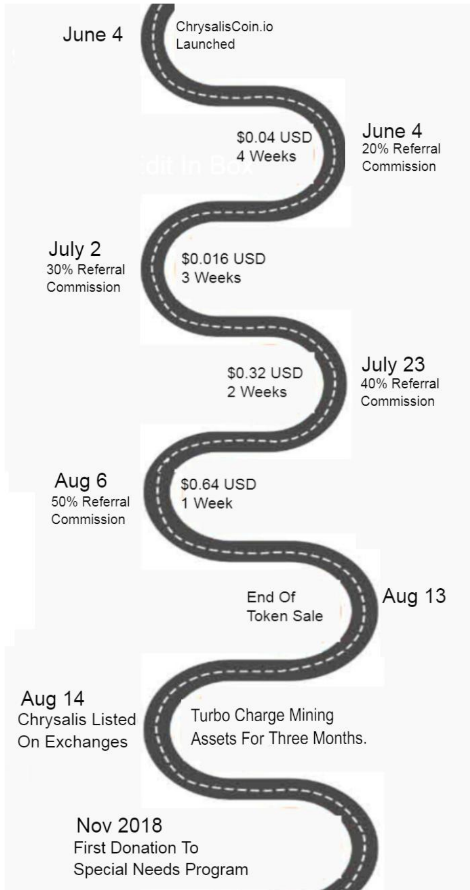
Tabella di marcia